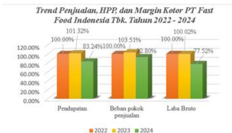
Gambar 1 Analisis Trend Penjualan, HPP, dan Margin Kotor Tahun 2022

Hasil analisis Common size atas aktiva PT Fast Food Indonesia Tbk. periode 2022–2024 menunjukkan pergeseran struktur aset. Proporsi kas dan setara kas turun dari 14,36% (2022) menjadi 1,84% (2024), sedangkan persediaan turun dari 9,08% menjadi 6,94%. Mengacu pada kriteria penilaian, aset lancar yang menurun mencerminkan melemahnya dukungan likuiditas jangka pendek perusahaan (Mulyana dkk., 2024). Pada saat yang sama, proporsi aset tidak lancar meningkat dari 66,72% (2022) menjadi 82,53% (2024), dengan kenaikan aset tetap dari 16,17% menjadi 24,92% (Mulyana dkk., 2024). Pergeseran ini sesuai fungsi analisis Common size untuk membaca perubahan struktur keuangan melalui perubahan proporsi antarpos (Rustiana dkk., 2022) dan dapat dipahami melalui Resource-Based View yang menekankan pengelolaan sumber daya internal (Dasuki, 2021).